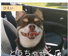
犬太郎&つくねが行く

※下のQRコードをスマホで読み取ると、ユーチューブに移動して動画を見ることができます。